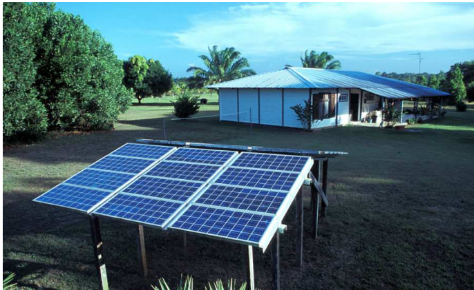
Générateur photovoltaïque autonome, Sinnamary

Des années 1980 à 2005, l'électricité photovoltaïque a essentiellement concerné les sites isolés de Guyane qui ne pouvaient accéder au réseau classique d'électrification. Cette technologie a permis à des centaines de foyers guyanais, situés sur le Maroni, l'Oyapock, à Saül, Kaw et même sur le littoral, de s'affranchir de leur groupe électrogène qui génère des dépenses de carburant de 2000 €/an pour seulement quelques heures de fonctionnement par jour. La