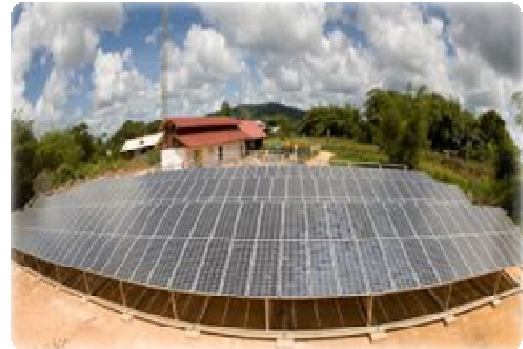
Centrale en site isolé à Kaw

- Une solution d'avenir pour les sites isolés : aujourd'hui ce sont les villages de l'intérieur (800 à 1500 habitants, comme Providence, Elae, Talwen, ...) qui bénéficient des dernières avancées de cette énergie (centrales photovoltaïques hybrides 1 ) dont la maturité et la fiabilité ne sont plus à démontrer. Par ailleurs, le développement, l'installation et l'entretien de systèmes photovoltaïques autonomes peut permettre la création d'activités dans les zones reculées. Dans ces bassins de vie, le GENERG soutient l'apprentissage des métiers proposant un service énergétique adapté aux usagers et aux ressources disponibles localement.