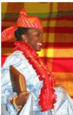
Coiffe réalisée par M. Castor

La coiffe Tahitienne (couronne de fleurs) par Mme Blanca SORIANO