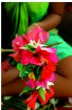
Préparation couronne de fleurs Crédits Crédit photo : Aravehi couronne de fleurs Tahiti