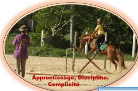
Apprentissage, Discipline, Complicité